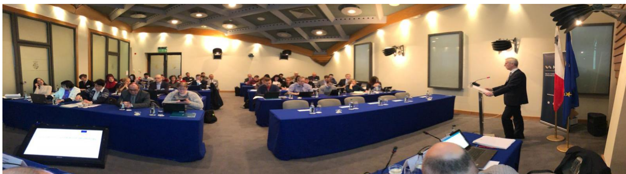
Фото: JA2016 Годишен семинар по надзор на пазара, Малта

За да се отрази нарастващото значение на е-търговия, голям брой образци от проверените продукти са закупени чрез онлайн магазини. Проектът се координира от PROSAFE , неправителствена организация с идеална цел, създадена от експерти по надзора на пазара, със седалище в гр. Брюксел.