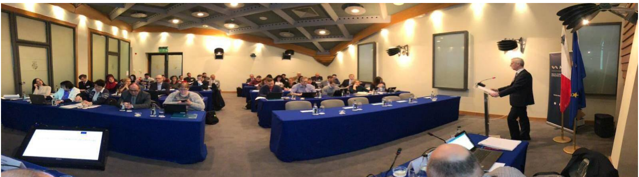
Фото: JA2016 Годишен семинар по надзор на пазара, Малта

За да се отрази нарастващото значение на е-търговия, голям брой образци от проверените продукти са закупени чрез онлайн магазини. Проектът се координира от PROSAFE , неправителствена организация с идеална цел, създадена от експерти по надзора на пазара, със седалище в гр. Брюксел.