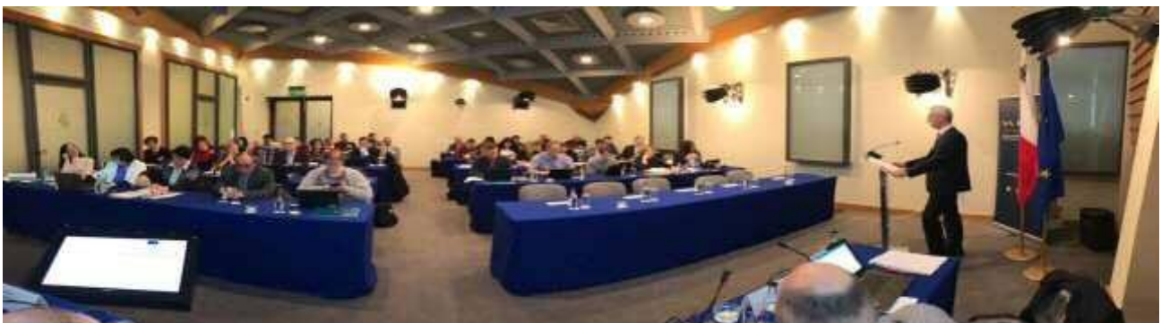
Foto: Výročný workshop v oblasti dohľadu nad trhom JA2016 na Malte

S cieľom vyjadriť čoraz väčší význam elektronického obchodovania boli mnohé kontrolované výrobky odobraté ako vzorky z e-shopov. Projekt koordinuje PROSAFE , nezisková mimovládna organizácia tvorená úradníkmi pre dohľad nad trhom so sídlom v Bruseli.